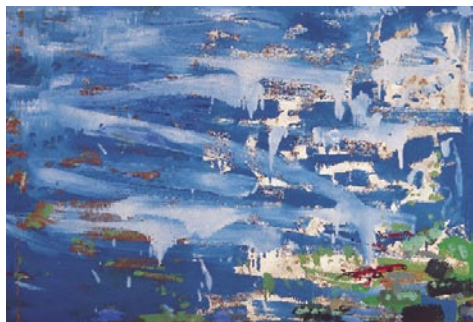
Món submarí, 1962 Pigments naturals sobre taula 122 x 178 cm

AQUESTA GRAN I PROFUNDA LLACUNA és tan blava, tan quieta, tan transparent que el món madrepòric hi apareix com l'escenari d'un conte de fades. Dins d'aquell gran safir que birbilleja sota el sol, es transparenta el jardí de les meravelles, els arbres de mil branques, les branques de mil fulles. Les flors de mil formes i colors alternen amb les algues verdes i gegantines que fan elegants reverències a algun personatge submarí amagat. Una munió de peixos de formes, dibuixos i matisos variats neden elegantment entre les plantes del corall i el verd i el roig i el groc i les ratlles més o menys amples i les taques més o menys grosses i multifformes, conjunt de línies i superfícies de la lluent cuirassa de llurs escates.