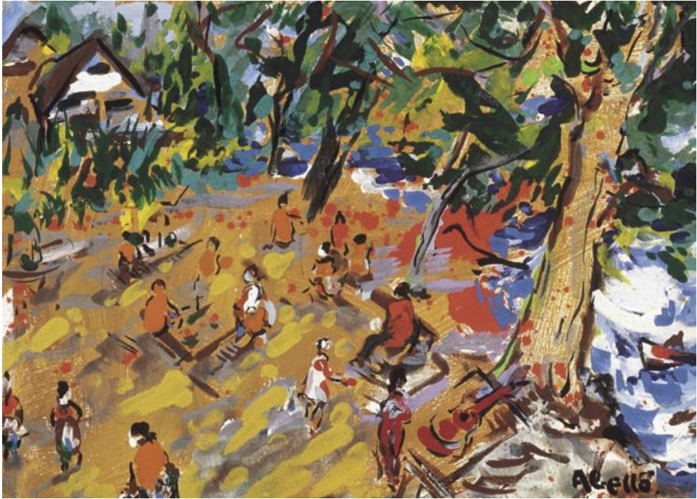
Motu Ovirí, Musée Gauguin, Tahiti. 1905. Pigments naturals sobre fusta. 38 x 46 cm.

T'havia somniat quan era infant, i passava llatí i geografia, i em fregava el desig, de tant en tant, la líquida i dispersa Oceania.