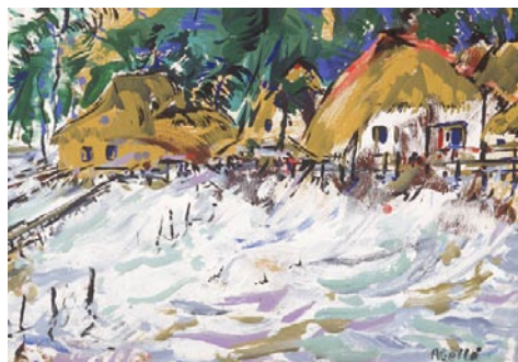
Platja de Tepua, Raiatea. 1995 Pigments naturals sobre fusta 38 x 46 cm

QUAN ES VA FER DE DIA arribarem a Farriniatea, cap de l'illa de Huahine. Aquests wharfs polinèsis, en la netedat matinal, sembla que acabin de néixer; tot hi és tendre i humit com si sortís d'una tavella verda, com si l'aigua, els arbres, els peixos i els sospirs fossin encara intactes; tot sembla de seda i per a estrenar. És per això que quan deixeu la goleta i trepitgeu el port la primera glopada d'ambient que us entra a la boca us fa l'efecte d'un gra de moscatell glaçat. Després vénen, però, les purulències del tròpic a tacar-vos la retina. No vàrem tardar dos segons sense l'espectacle del fefé més cru i més inflat; i no un cas, sinó una colla.