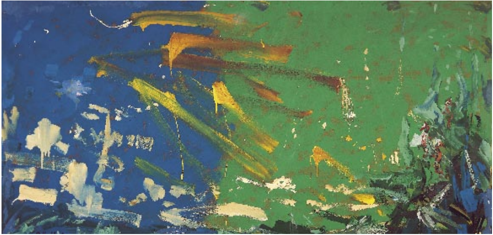
Món submarí, 1962 Pigments naturals sobre taula 122 x 244 cm

Dins la piragua anem Poroi i jo, i el vidre del lagon es transparenta; ni una mica de vent, ni un ai, ni un so, l'aire és gelatinós, l'aigua és calenta.