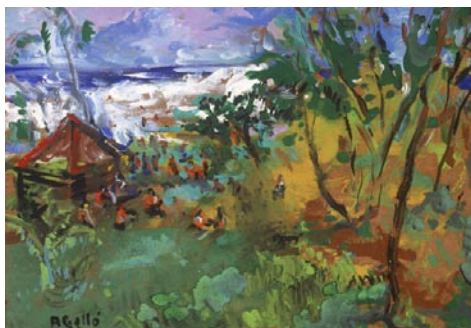
Hiti Mabana, Mahina. 1995 Pigments naturals sobre fusta 38 x 46 cm

Aurora Bertrana, Paradisos oceànics , Columna, Barcelona 1993, p. 42