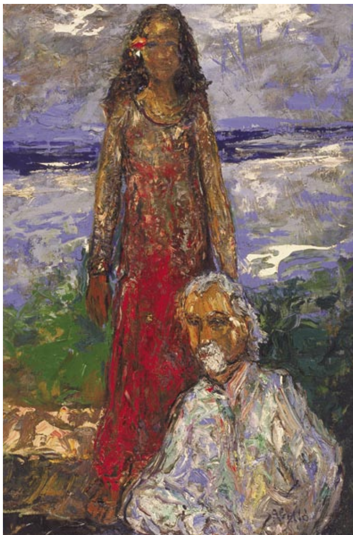
Nora Naboe i Jo, a l'illa de Pasqua, 1995 Oli sobre tela 146 x 114 cm