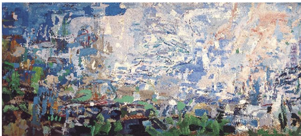
Món submarí, 1962 . Pigments naturals sobre taula. 108 x 244 cm

Aurora Bertrana, Memòries fins al 1935 , Pòrtic, Barcelona 1973, p. 641-2