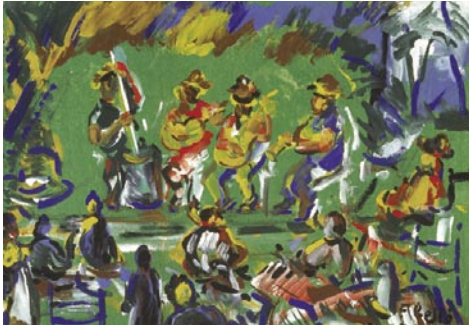
Café du Marché, Papeete, Tahiti. 1995 Pigments naturals sobre fusta 38 x 46 cm

No em diguis que aquest cant, que és i no és de tan dolç que m'arriba a la veranda, és la torna de llit d'uns mariners despatxats per anar a Nova Zelanda.