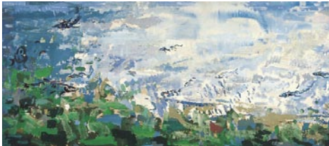
Món submarí , 1962 Pigments naturals sobre taula 108 x 244 cm

Josep M. de Sagarra, La ruta blava , Selecta, Barcelona 1964, p. 148