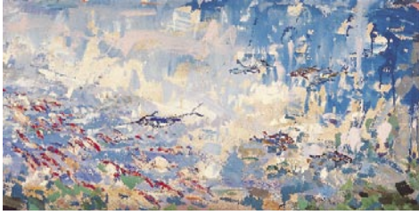
Món submarí , 1962 Pigments naturals sobre taula 108 x 200 cm

L ESPECTACLE DEL PEIX de forma rara i qualitat preciosa dins l'aigua dels lagons substitueix la manca de plomes metàl·liques i creïstes estridents en la tebior de l'aire. Els crustacis i els molluscs són aquí en varietat i en bellesa únics; i els zoòfits (tan perillosos!) arriben a esgotar l'admiració; les arborescències madreporiques, enormes, rosades, virolades o d'un groc de crom, corrosives, amb una insuportable olor d'àcid fosfòric, fan rodar el cap.