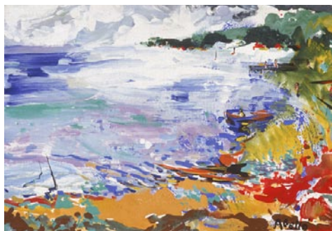
Fare Port, Huabine. 1995 Pigments naturals sobre fusta 38 x 46 cm