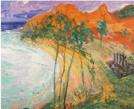
Platja d'Anaquena, Illa de Pasqua. 1995 Pigments naturals sobre fusta. 38 x 46 cm.

Aurora Bertrana, Peikea princesa canibal i altres contes oceànics , Pleniluni, Alella 1980, p. 149