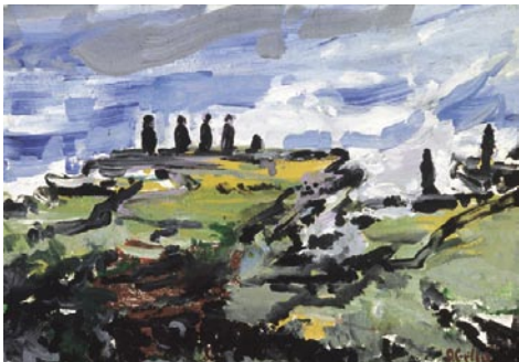
Abu Tabití, Rapa Nui, Illa de Pasqua. 1995 Pigments naturals sobre fusta. 38 x 46 cm.

Aurora Bertrana, Paradisos oceànics , Columna, Barcelona 1993, p. 39-41