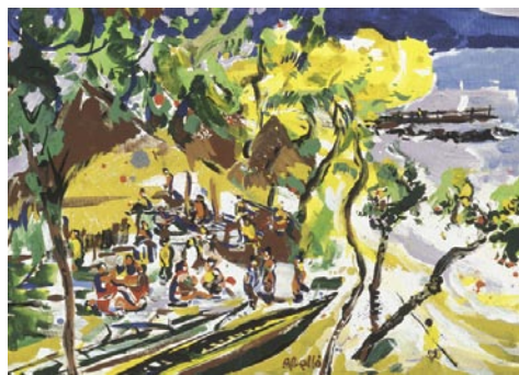
Bali Hay Plage, Hoahine. 1995 Pigments naturals sobre fusta. 38 x 46 cm.

H UHAINE ENS MOSTRA les seves crestes agudes de formes capricioses i les seves profundes i estretes valls amb una vegetació verda i atapeïda. Des de la goleta, hom distingeix perfectament el pas obert en el corall i el braç de mar que s'endinsa a l'illa i gairebé la divideix en dues. Efectivament, si les dues terres agermanades s'acoblen sota el nom d'Huahine, cada una d'elles ha estat també batejada. La més secreta i deserta és Matairea ("poc vent"), la més visible i freqüentada: Huahuatëaru ("escuma d'onada"). La capital és Fare: un grapat de cabanyes de bambú i pandanàcia, ben visibles des del nostre vaixell amb les piragües amarrades al desembarcador de fusta i les altes plantes d'hibiscus esquitxades de flors vermelles i de color de rosa.