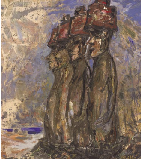
Abu Nau Nau, Rapa Nui, Illa de Pasqua. 1995 Oli sobre tela 156 x 135 cm

P ERÒ, ¿què representa aquesta horrible figura deformada, estrafolària, esculpida a cops de pedra en un bloc de granit? ¿És home, és dona, és bèstia?