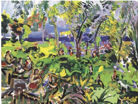
Chicote amb la guitarra, Faaone, Tahiti. 1995 Pigments naturals sobre fusta 38 x 46 cm

Josep M. de Sagarra, Entre l'Equador i els tròpics , Seleçta, Barcelona 1947, p 74-75