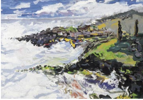
Caleta Hangaroa, Illa de Pasqua. 1995 Pigments naturals sobre fusta. 38 x 46 cm.

TOT D'UNA es trobà fit a fit amb el déu. Restà glaçat, immòbil, tremolós. Una follia li resseguí els nervis. L'ídol era allà, prop seu, encimbellat damunt una plataforma de carreus, mena d'altar bàrbar i primitiu. Només li calia avançar unes passes i el tresor era seu! El contemplà extasiat. [...] Estava tallat en un sol bloc de basalt. Com tots els ídols polinesis, representava la imatge grossera d'una criatura humana assegurada. Resultava difícil determinar el sexe.