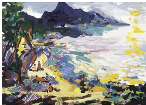
Bali Hay Plage, Hoahine. 1995 Pigments naturals sobre fusta. 38 x 46 cm.