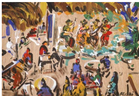
Restaurant del mercat, Papeete, Tahiti. 1995 Pigments naturals sobre fusta 38 x 46 cm

A LS MENJADORS, les serventes tahitianes acuden amatents, amb el somriure clar, la roba neta, els peus descalços i els cabells estesos. porten corones i collars de tiaré. Guarneixen de flors els assistents, amb graciosa espontaneïtat. tenen els ulls brillants, picarescs, prometedors. Més tard, als jardins apartats de la vila o a les platges, sota l'ombra dels alts cocoters, els turistes viuen les hores més belles del dia, en una placidesa inconscient. Tot hi ha contribuït. Els vins francesos, les noies maoris, el perfum penetrant de les flors polinèsies. també als cafès i bars de la vila hi ha animació.