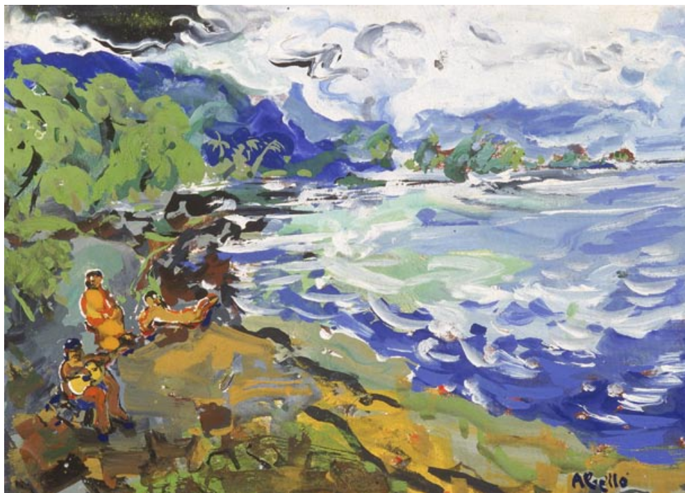
Pueu, Polinèsia. 1995. Pigments naturals sobre fusta. 38 x 46 cm.

A NEM SEGUINT LA RUTA BLAVA, d'un blau que varia fins a l'infinit, que passa per tots els matisos. Des del blau Nattier més d'ulls de princesa fins al blau de les venes inflades, fins al blau moradenc de l'estrangulació, fins al blau pàl·lid tèrbol de cendra i d'impotència de les galtes que agonitzen. Polinèsia, blau del cel, del mar i de les illes. Berille, safir, turquesa, blau opac, blau translúcid. Entre aquests blaus allucinants, n'hi ha un que fa por: és el de la rebava que emergeix entre les dues cloves d'aquestes petxines enormes, d'una blancor pura, incrustades dins del coral, típiques de totes les mars del tròpic, i que la indústria religiosa fa servir per a convertir-les en piques d'aigua beneita.