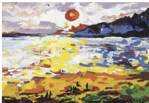
To Paraà Mahana, Pundavia. 1995 Pigments naturals sobre fusta 38 x 46 cm