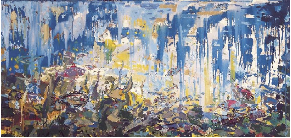
Món submergit , 1962 Pigments naturals sobre taula 122 x 244 cm

R EPOSA ALGUNS SEGONS aïfada prop de la llacuna, com fascinada per aquella quietud i transparència incomparables. Tot d'una s'hi tira de cap, s'endinsa en el món del coral i la mareperla. Peixos blaus, pigats de groc; peixos color salmó, amb ratlles blaves; peixos vermells, amb estries negres; peixos verds, d'escates argentades, fugen espantats dels seus braços estesos, esquincen la massa aquàtica, ràpids i lluents com llampecs.